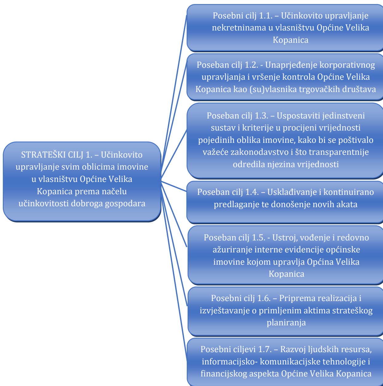
Slika 2. Kaskadiranje strateškog cilja upravljanja općinskom imovinom