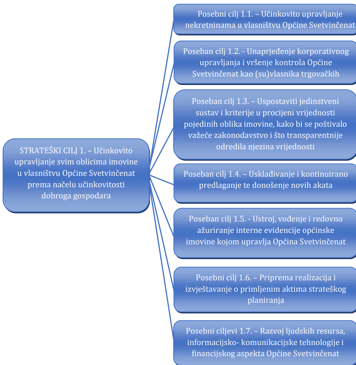
Slika 2. Kaskadiranje strateškog cilja upravljanja općinskom imovinom