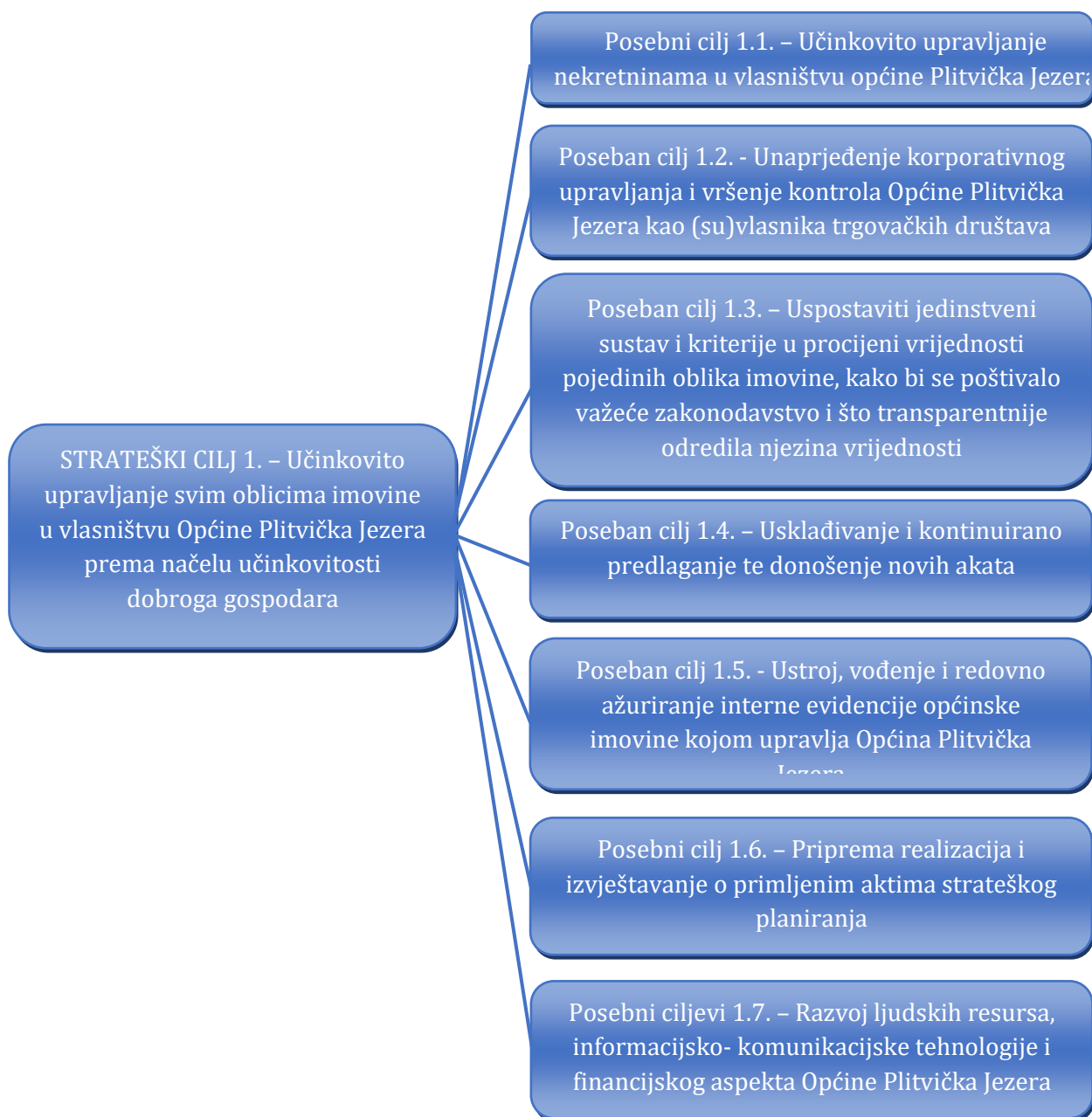
Slika 2. Kaskadiranje strateškog cilja upravljanja općinskom imovinom