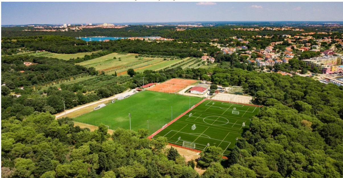
Slika 1. Nogometno igralište Premantika i Pomoćno nogometno igralište Premantika u Banjolama, na području Općine Medulin