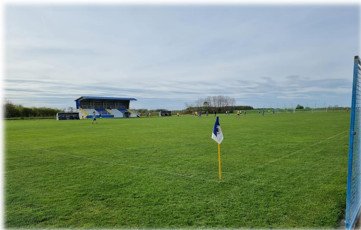
Slika 1. Nogometno igralište Š.R.C. Marko Bilandžić

Načine postupanja vezane uz prodaju, davanje u zakup ili najam, nabavu roba, radova i usluga i druge oblike upravljanja nogometnim igralištem, od donošenja odluka do evidentiranja u poslovnim knjigama i vrednovanja ostvarenih učinaka, Općina Feričanci nije uredila.