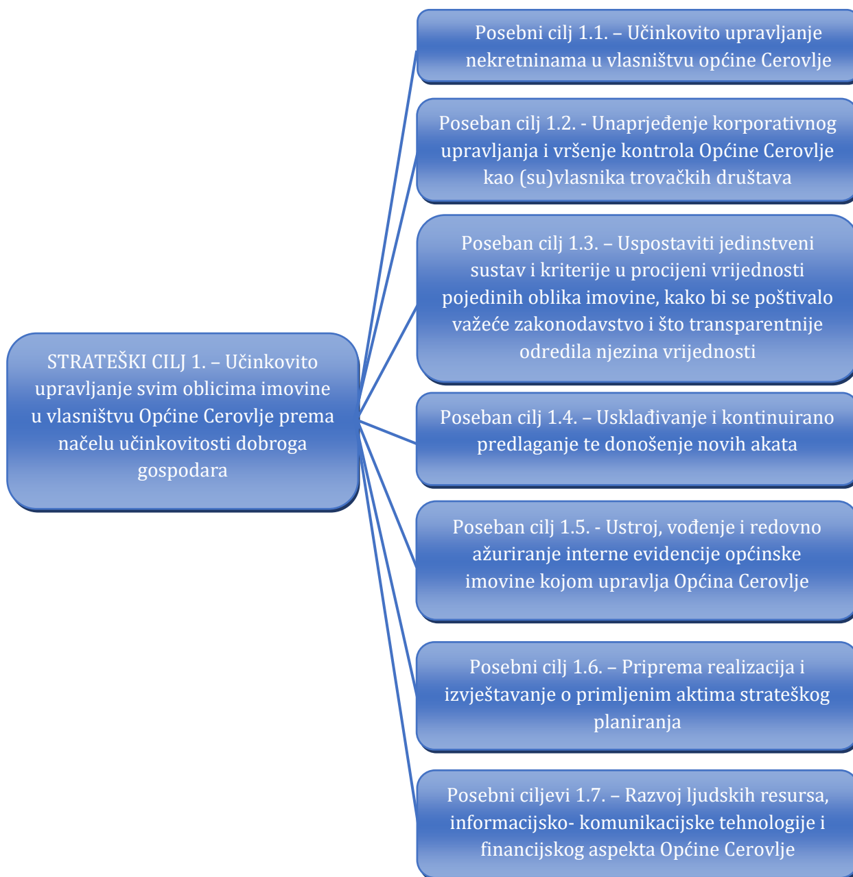
Slika 2. Kaskadiranje strateškog cilja upravljanja općinskom imovinom