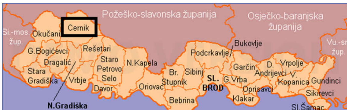
Slika 1. Administrativne granice Općine Cernik unutar Brodsko-posavske županije

Prema podacima Agencije za zaštitu okoliša (AZO) u Brodsko-posavskoj županiji tijekom 2014. godine sakupljeno je 39.533 t komunalnog otpada, od čega je 35.731 t predano odlagalištima. Ukupno je sakupljeno 31.780 t miješanog komunalnog otpada (ključni broj 20 03 01). Ostalih odvojeno sakupljenih vrsta komunalnog otpada bilo je 7.753 t.