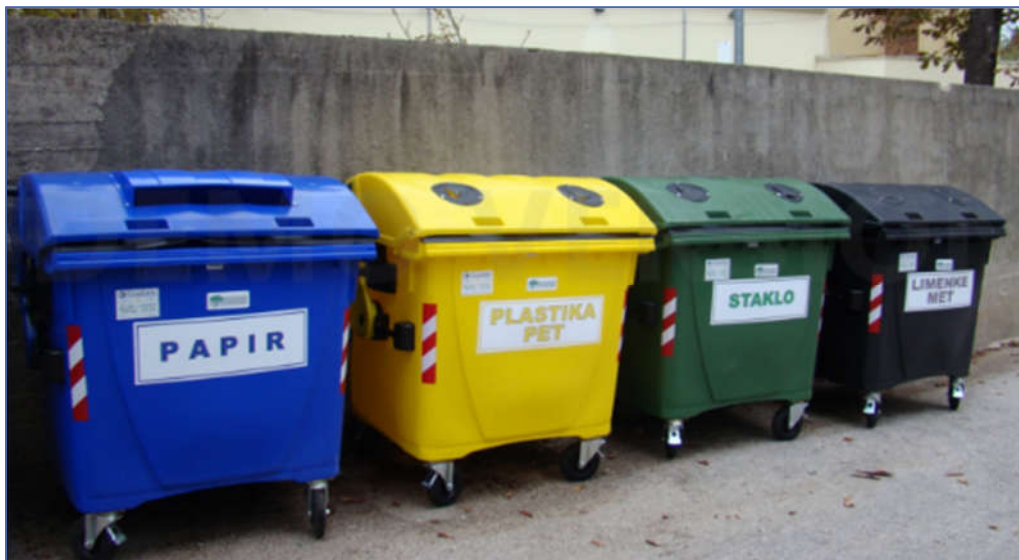
Slika 2: Prikaz zelenog otoka

Posude i kontejneri za miješani komunalni otpad zapremine 120, 240, 1100 lit i 5m 3 smješteni su uglavnom unutar objekata i drugih prostora za tu namjenu, tamo gdje to nije moguće na javnim površinama, što se prvenstveno odnosi na posude i kontejnere veće zapremine (1100 lit, 5m 3 i 7m 3 ).