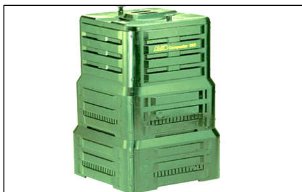
Slika 5: Posude za primarnu selekciju komunalnog otpada, komposter za kućanstvo

Općina Cernik će u 2017.godini uvesti odvojeno sakupljanje papira, stakla, plastike i tekstila putem kontejnera od 1100 litara koji će biti raspoređeni u naseljima Cernik, Cernička Šagovina, Baćin Dol, Šumetlica, Opatovac, Podvrško, Baničevac, Giletinci i izletištu Strmac. U 2017. i 2018. godini Općina Cernik planira nabavu još nekoliko posuda i kontejnera za staklo, plastiku, metal i tekstil, kako bi izvršila sve obveze sukladno Zakonu o održivom gospodarenju otpadom. Termini odvoza biti će objavljeni na web stranicama koncesionara