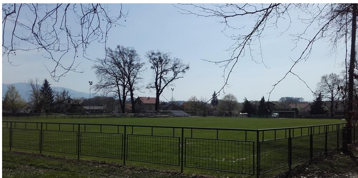
Slika 2. Nogometno igralište Oroslavje

Lokalne jedinice, u propisanim okvirima, samostalno određuju pravila i procedure upravljanja i raspolaganja vlastitom imovinom, odnosno nogometnim stadionima i igralištima. Način, ovlasti, procedure i kriteriji za upravljanje i raspolaganje mogu se utvrditi unutarnjim aktima.