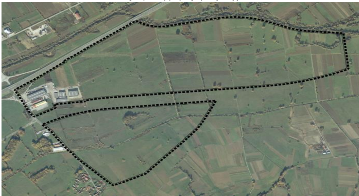
Slika 1. Radna zona Mokrice

Na području Grada Oroslavja nalazi se Radna zona Mokrice, koje je smještena u Mokricama, nadomak autoceste Zagreb–Macelj i nove prometnice brze ceste koja povezuje Oroslavje s državnom cestom prema Zlatar Bistrici, Mariji Bistrici te s autocestom Zagreb–Varaždin. Ukupna površina zone je 120.000 m 2 . Razvoj radne zone Mokrice usmjeren je kao malo razvojno središte te kao takvo, ima ulogu generatora razvoja u Gradu. Položaj na križanju važnih državnih cestovnih pravaca i neposredna blizina Grada Zagreba također pogoduje razvoju ovog dijela naselja. Ovako dobra prometna povezanost s ostatkom županije i države zasigurno pruža vrlo dobre preduvjete za razvoj radne zone.