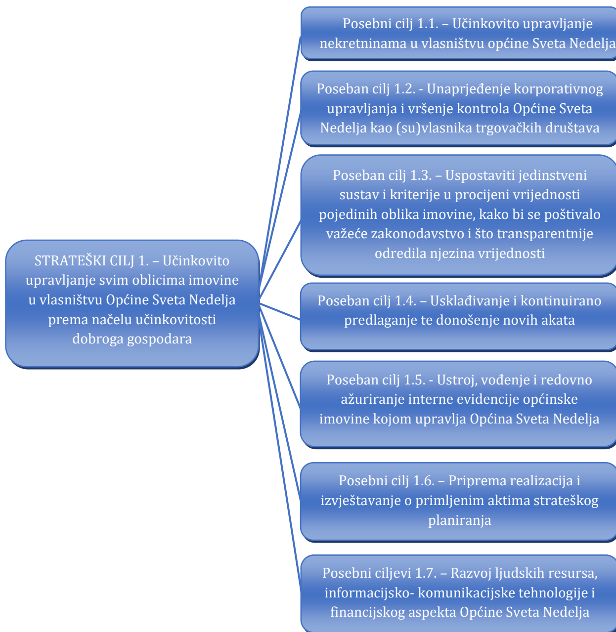
Slika 2. Kaskadiranje strateškog cilja upravljanja općinskom imovinom